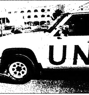
جندي عملي يراقب برفقاً تامة تلام للتحفة في بغداد امس (الاحد)

واشنطن - لندن - قالته المحكمة الفيدرالية الأمريكية أنها وجدت أدلة كافية لإدانة اثنين من المشتبه بهم في هجمات 11 سبتمبر، وهما بن لادن وابو حفص، بتهمة نقل أسلحة ومتفجرات إلى السعودية. وقالت المحكمة في قرارها الصادر في 11 نوفمبر/تشرين الثاني 1998، إن الاثنين كانا جزءاً من محاولة لتنفيذ عملية تخريبية في مدينة جدة خلال 14 شهراً من عام 1992. ووفقاً للمحكمة، فقد تم تسليم أسلحة ومتفجرات إلى اثنين من عملاء المخابرات الأمريكية في مدينة جدة، وهما بن لادن وابو حفص، في عام 1992.